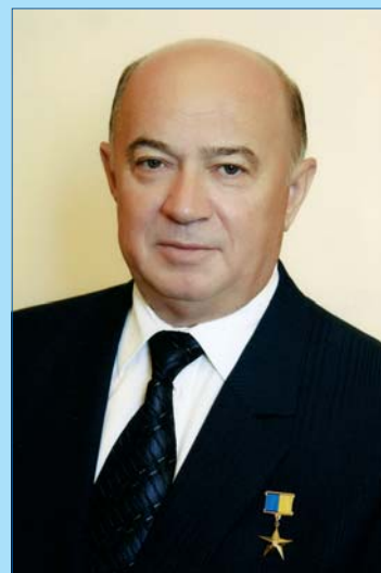
Василь Якович ТАЦІЙ, ректор Національного юридичного університету імені Ярослава Мудрого, академік НАН України

Хочу побажати випускникам різних років надалі зберігати нерозривність зв'язків з Університетом, підтримувати, зміцнювати і примножувати традиції і досягнення нашої Alma Mater. ■